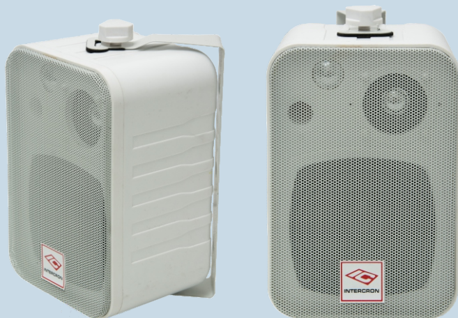
Bafles Modelo GT - BQ245/T