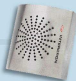
Bafle de Acero Inoxidable para Vidrio