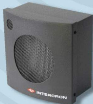
Bafle Potenciado para Exterior