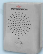
Bafle de Acero Inoxidable para intemperie