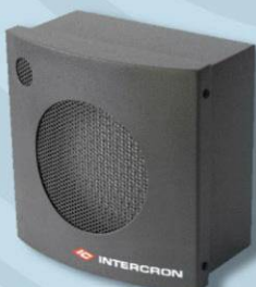
Bafle Potenciado para Exterior