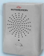
Bafle de Acero Inoxidable para intemperie